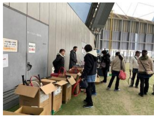
好みのラケットを探して熱戦が繰り広げられました!!