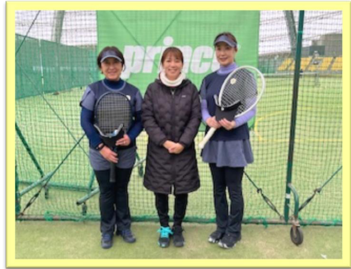
可愛いプリンスのウェアで楽しくテニスが出来ました。ありがとうございます♡