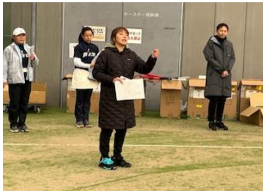
プリンスラケットのご紹介☆